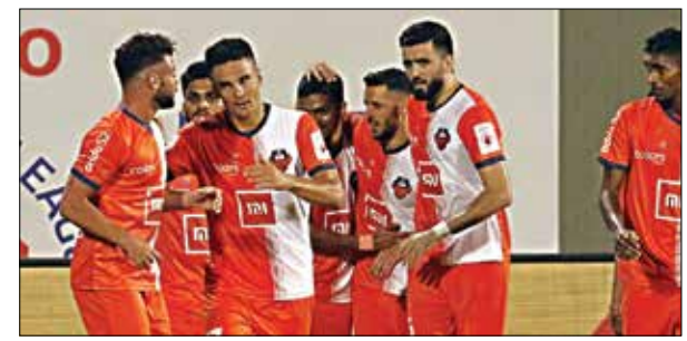
the play-off hunt.

ATK, on the other hand, started the new year with a win and a two draws too remain in